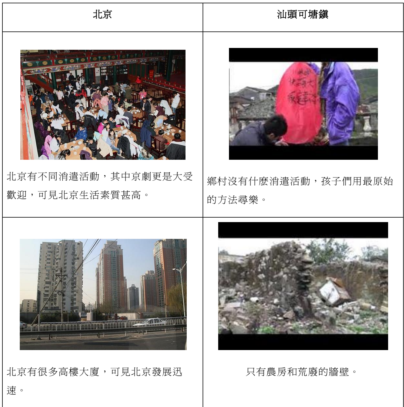
表 2：北京和汕頭可塘鎮雙貴村居民的生活素質的比較