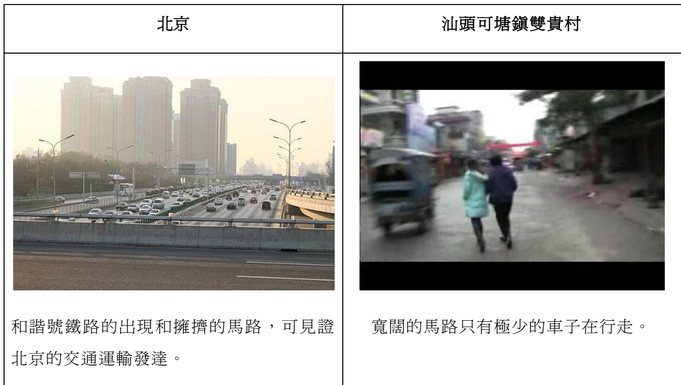
表 1：北京和汕頭可塘鎮雙貴村居民的生活素質的比較